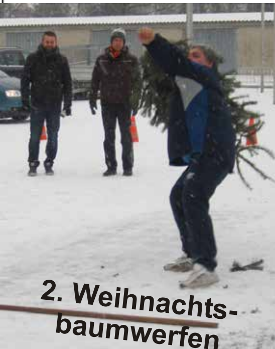
2. Weihnachts- baumwerfen

Unsere nächste Mitgliederversammlung findet am 08. April 2016 im Vereinshaus statt (weitere Informationen auf der Rückseite)