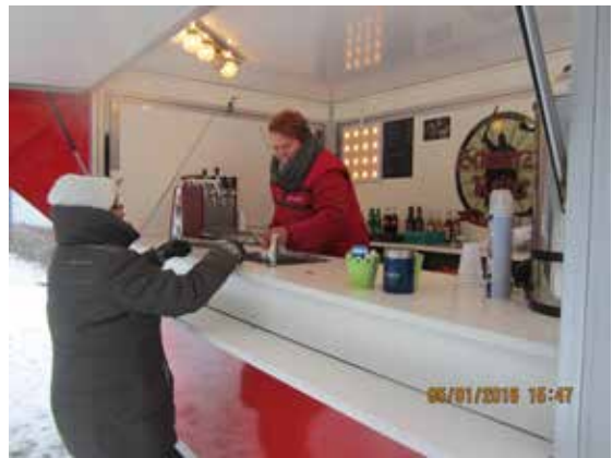
Danke an Novi's Team